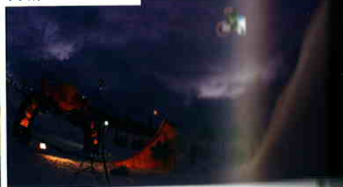
74 KONA WHITE STYLE